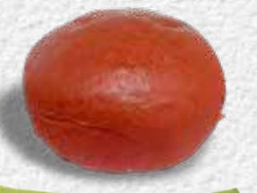
CHEFLINE KIRMIZI HAMBURGER BUN 80 g x 8 adet x 9 paket