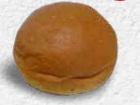
CHEFLINE TURUNCU HAMBURGER BUN 80 g x 8 adet x 9 paket