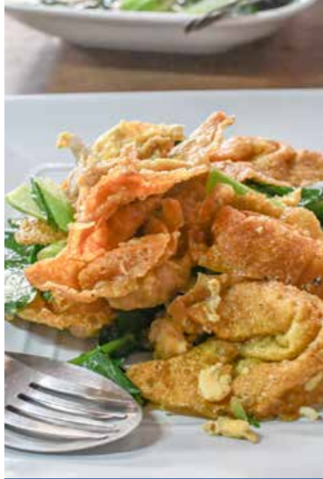
PRAWN WONTON-KARİDESLİ KIZARTMA ÇİN MANTISI (18 g x 24 adet) x 10 paket

Nişasta ile hazırlanmış şeffaf ve ince bir hamurun içine, bol miktarda ve leziz bir karides dolgusu ile hazırlanmış, buharda pişirilerek yenilen, Çin aperatifi.