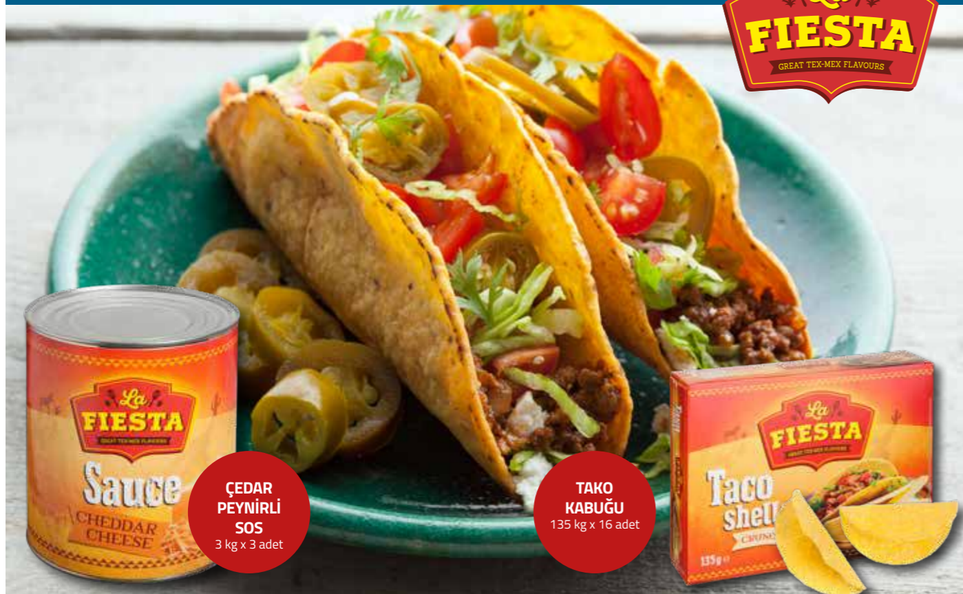
ÇEDAR PEYNİRLİ SOS 3 kg x 3 adet