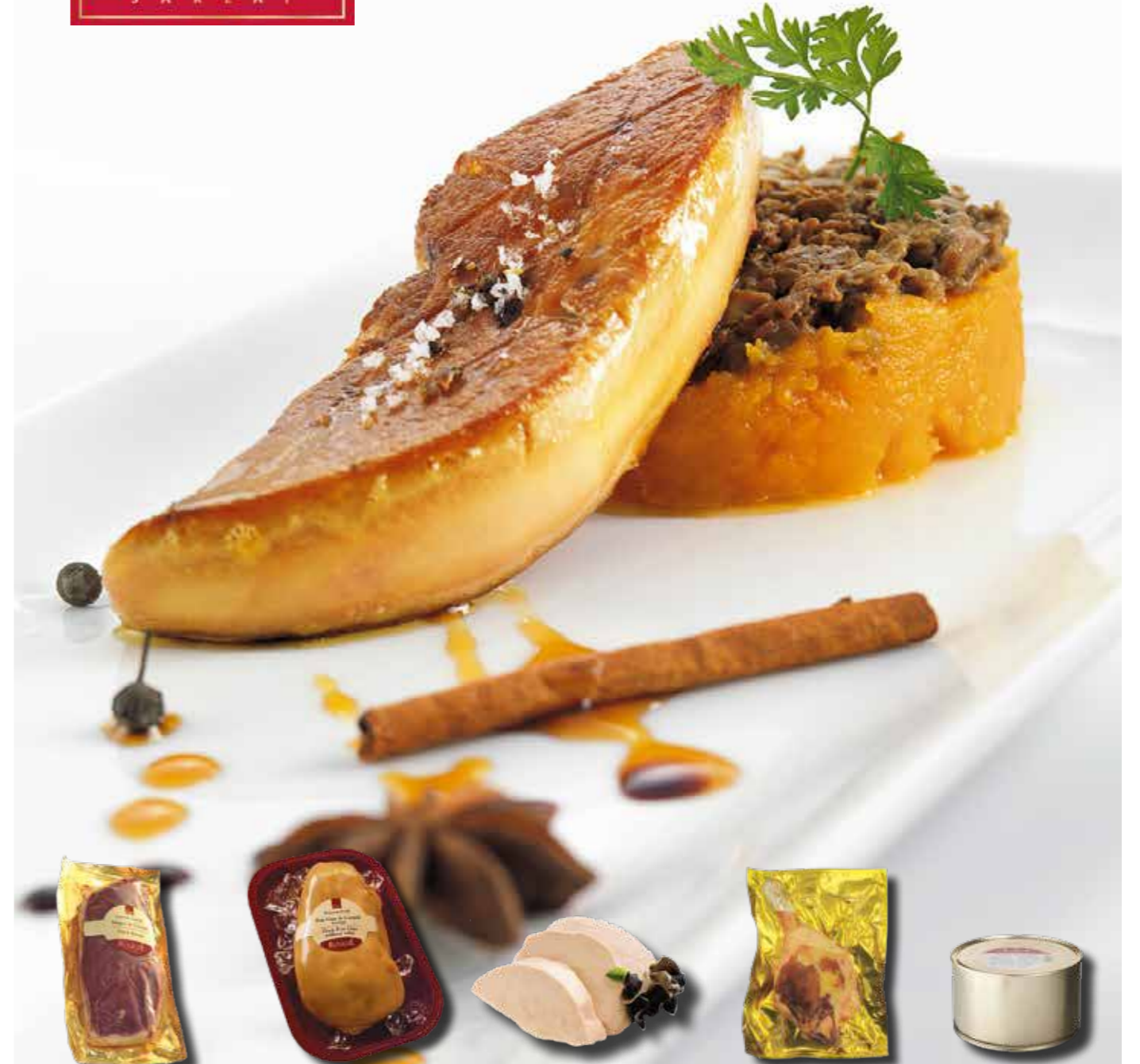
ÖRDEK GÖĞÜS ETİ 380-480 g (ort.) x 12 paket

Foie gras yapımı için beslenmiş ördeğin yağsız göğüs etidir. Kalın bir yağ tabakası, göğüs eti ile deri arasındadır. Bildiğimiz kümes hayvanı göğsünden çok daha lezzetli ve yumuşaktır. Tüm dünya mutfaklarında ızgaralarda kullanılır.