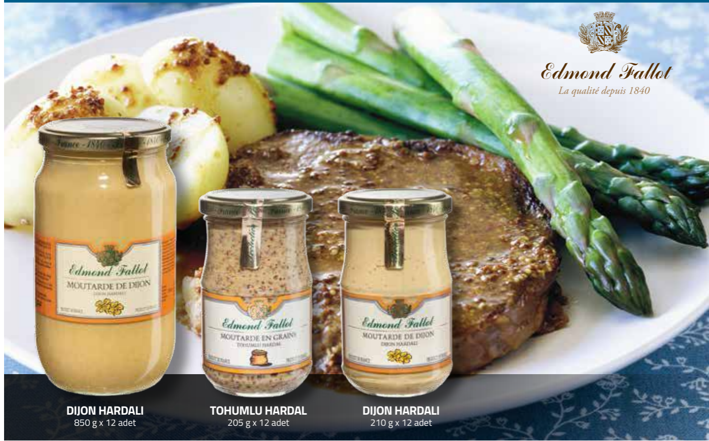
DIJON HARDALI 850 g x 12 adet