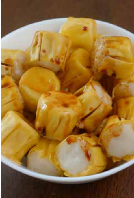
SHAOMAI - DENİZ MAHSULLÜ AÇIK ÇİN MANTISI (20 g x 24 adet) x 10 paket

Karides, mürekkep balığı, balık eti ve sebzelerle hazırlanmış buharda pişirilerek servis edilen uzakdoğu aperatifi.