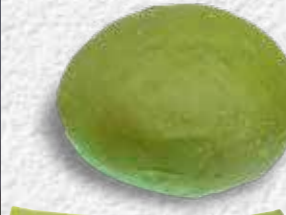
CHEFLINE YEŞİL HAMBURGER BUN 80 g x 8 adet x 9 paket