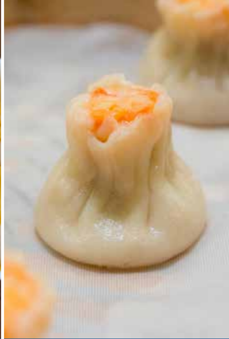
HARGOW-KARİDESLİ DUMPLING (18 g x 24 adet) x 10 paket

Karides, mürekkep balığı, balık eti ve sebzelerle hazırlanmış buharda pişirilerek servis edilen uzakdoğu aperatifi.