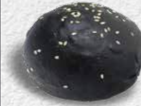
CHEFLINE SİYAH HAMBURGER BUN 80 g x 8 adet x 9 paket